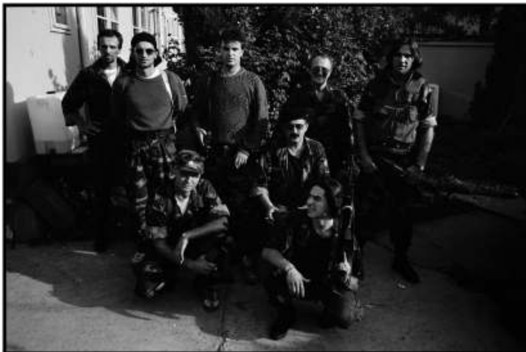
Grupa hrvatskih branitelja iz Vukovara, Žabe bukače