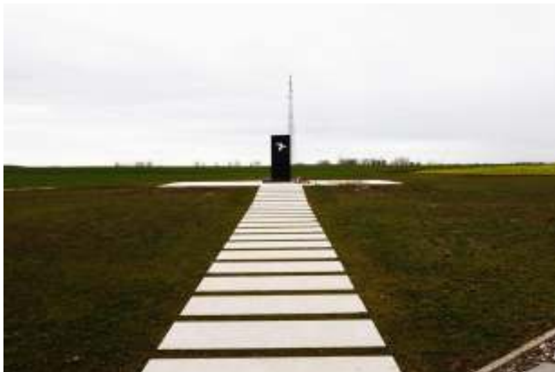
Spomen-obilježja mjesta masovnih grobnica žrtava iz Domovinskog rata