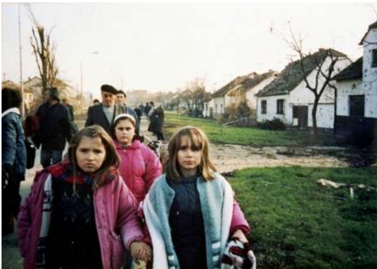
Vukovarska kolona prognanika, 1991.