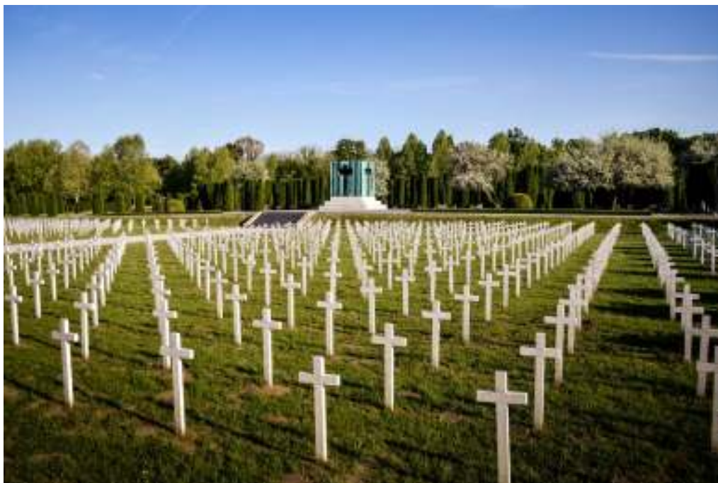
Memorijalno groblje žrtava iz Domovinskog rata u Vukovaru

U spomen na žrtve Domovinskog rata te žrtve Vukovara i Škabrnje 18. studenog je blagdan i neradni dan u Republici Hrvatskoj; svake se godine 18. studenog održava kolona sjećanja koja polazi iz dvorišta Vukovarske bolnice, kreće glavnom ulicom do Memorijalnog groblja žrtava iz Domovinskog rata u Vukovaru. Večer prije, u većini gradova u RH, uz ulice koje u svom imenu imaju Vukovar u različitim oblicima ili uz glavne trgove, pale se svijeće u znak sjećanja na sve stradale tijekom opsade i okupacije Vukovara.