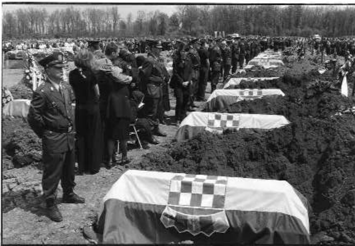
Zajednički ukop žrtava ekshumiranih iz masovne grobnice na Novom groblju Dubrava u Vukovaru, u proljeće 1998. godine

Žrtve Vukovara, civili i branitelji, ukopane su na Memorijalnom groblju žrtava iz Domovinskog rata u Vukovaru. Najmlađa žrtva, dječak Aleksander, imao je svega šest mjeseci kada je smrtno stradao zajedno s roditeljima.