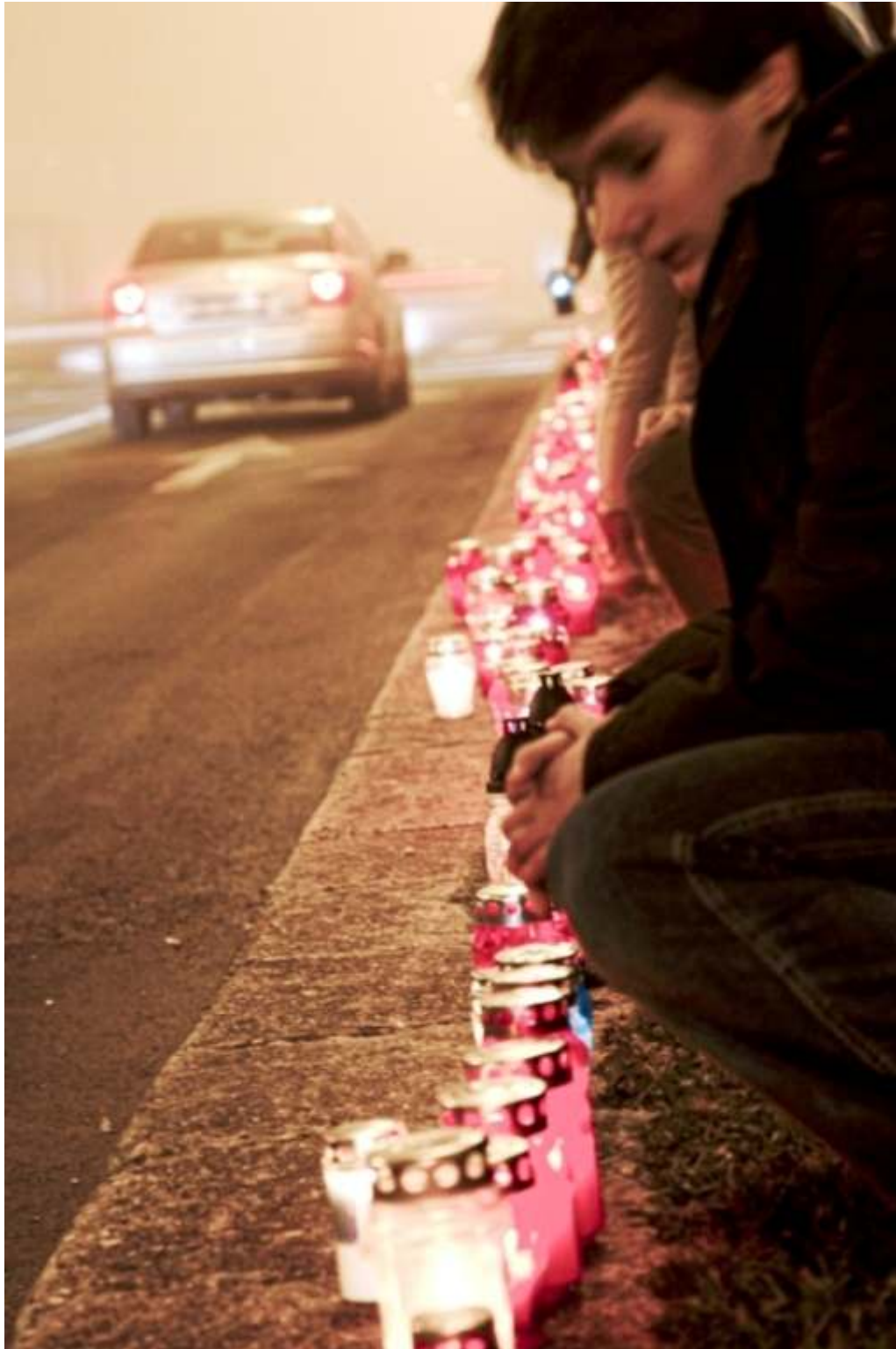
Paljenje svijeća uz ulice koje nose naziv grada Vukovara na Dan sjećanja na žrtve Domovinskog rata, žrtve Vukovara i Škabrnje