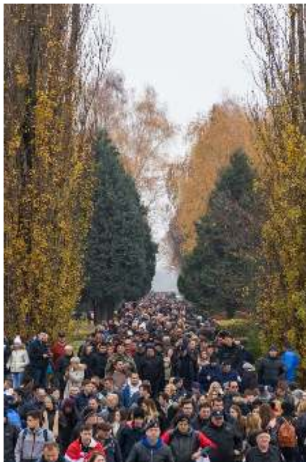
Dana sjećanja na žrtve Domovinskog rata i Dana sjećanja na žrtvu Vukovara i Škabrnje